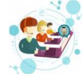
COMPONENTE 6. Mecanismos para Mejorar la Atención Al Ciudadano- Servicio A La Ciudadanía