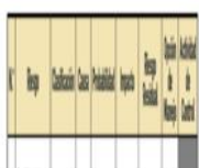
COMPONENTE 1. Gestión Del Riesgo de Corrupción – Mapa de Riesgo