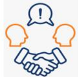
COMPONENTE 3. Legalidad, Integridad y Conflictos de Intereses