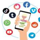
COMPONENTE 2. Redes Interinstitucionales y Canales de Denuncia