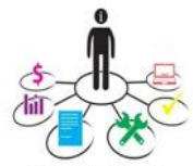
COMPONENTE 7. Mecanismos para la Transparencia y Acceso a la Información