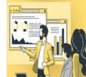
COMPONENTE 5. Rendición de Cuentas y Participación Ciudadana