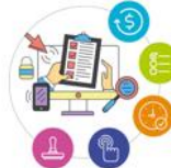
COMPONENTE 4. Racionalización de Tramites - Otros Procedimientos Administrativo (OPA)