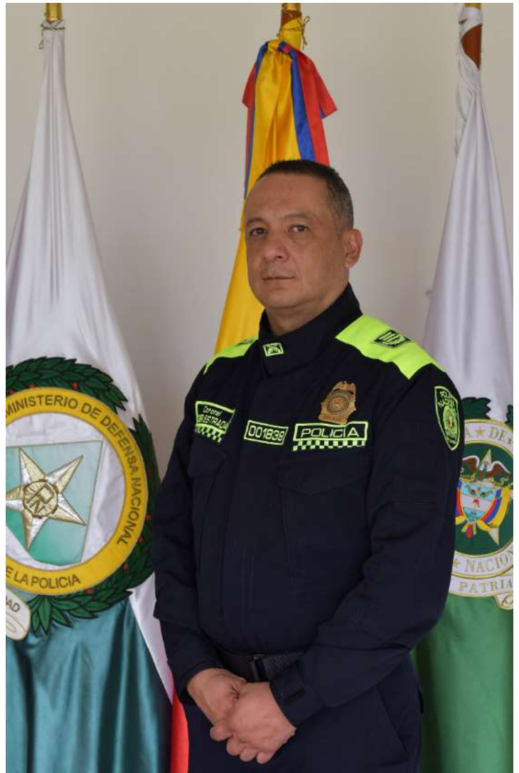
Director General del Fondo Rotatorio de la Policía Coronel Didier Alberto Estrada Álvarez

Hoy le apostamos a dar un paso agigantado en materia de innovación, enfocado a la optimización y aprovechamiento de los recursos, con el fin de continuar su ruta de elaborar los uniformes que visten los policías de Colombia, así como uniformados de otras instituciones de la fuerza pública y personal civil de diferentes entidades en todo el territorio patrio.