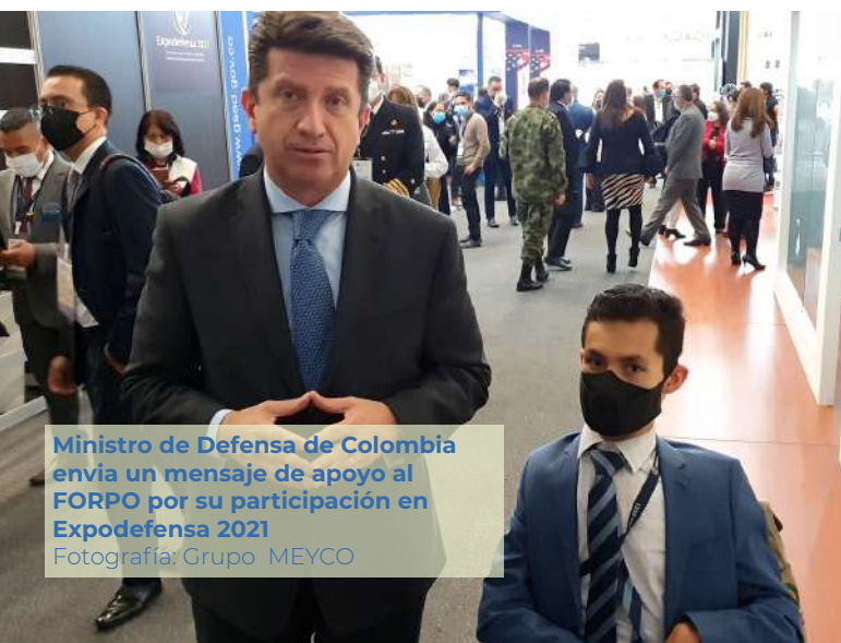
Ministro de Defensa de Colombia envía un mensaje de apoyo al FORPO por su participación en Expodefensa 2021

Para la inauguración, estuvieron presentes el Presidente de la República, Iván Duque Márquez y el Ministro de Defensa Diego Andrés Molano Aponte, este último se refirió a la importancia de realizar este tipo de eventos; “lo que buscamos es la cooperación para fortalecer nuestra fuerza pública en defensa del territorio”.