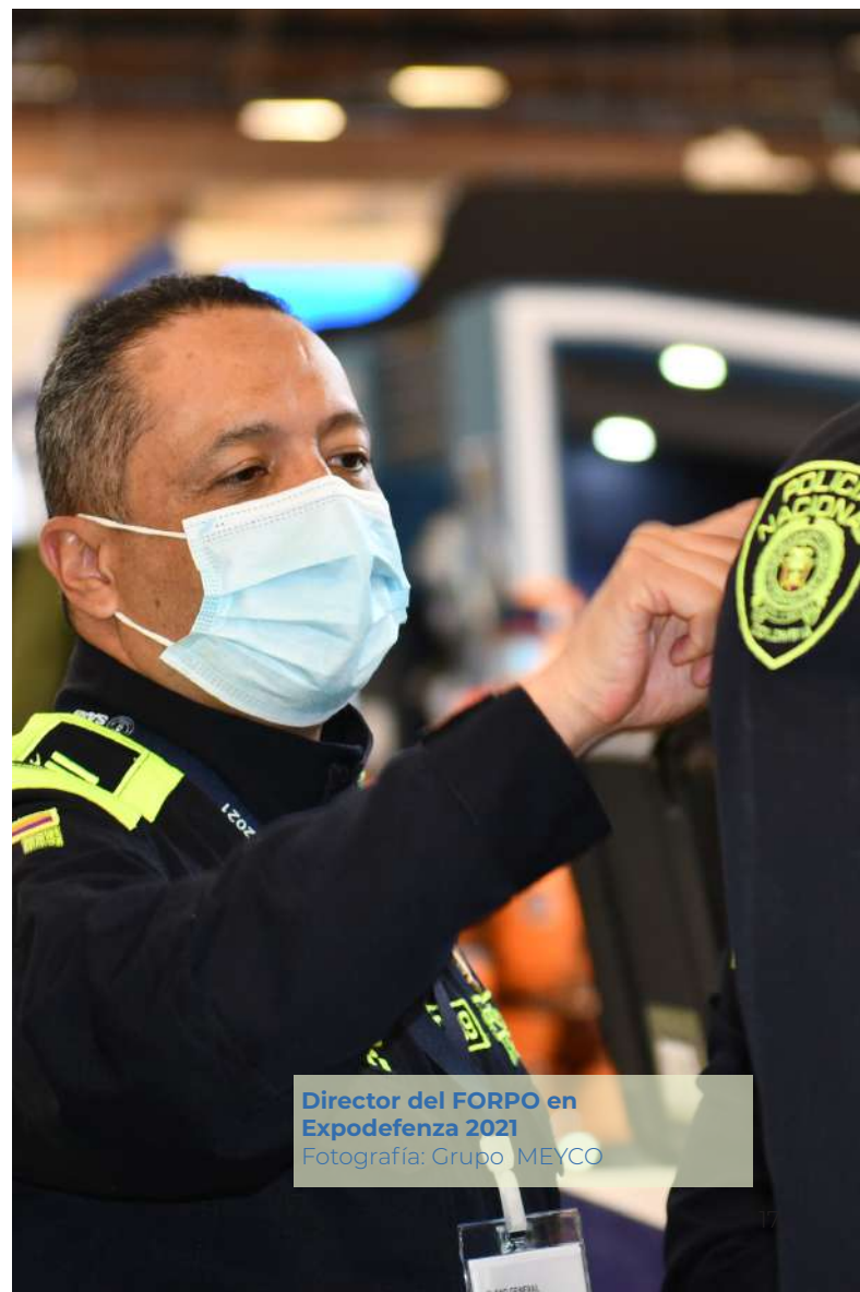
Director del FORPO en Expodefensa 2021

Finalmente, durante la visita, el Ministro de Defensa aprovechó para agradecer al Fondo Rotatorio por su incommensurable labor en el apoyo a la fuerza pública “...quiero hacer un reconocimiento a todos los que trabajan en Forpo, hoy tenemos como reto la transformación de la policía, para lo cual tenemos un proyecto de ley, y un elemento vital son los uniformes que van a portar con orgullo nuestros policías en la calle, uniformes más visibles, que generan más cercanía y que prometen la aplicación de tecnología. Por ese trabajo que ustedes hacen, gratitud inmensa en nombre de todos los colombianos”.