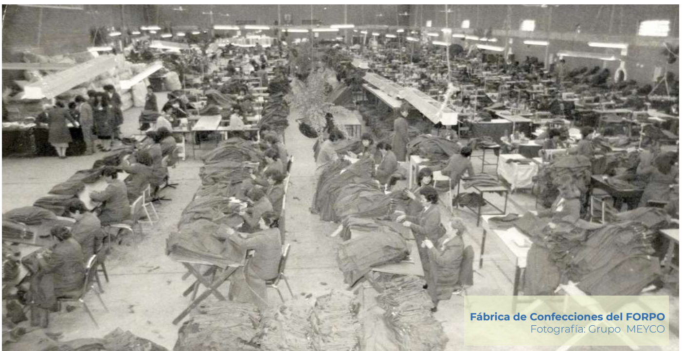
Fábrica de Confecciones del FORPO

Desde 1967, año en que fue adquirida la fábrica, se han mantenido algunos de los objetivos fundacionales que motivaron su adquisición, como la generación de empleo, la provisión de uniformes para la Policía Nacional y el desarrollo de un núcleo industrial. Sin embargo, el desarrollo y fortalecimiento de una industria no pueden detenerse; por ello se han estructurado nuevas líneas de productos, entre los que se cuentan productos de lencería, diversos tipos de bordados, dotaciones para personal civil, así como camisetas bordadas y estampadas. Con la implementación de estas nuevas líneas de producción, el Fondo Rotatorio tiene como estrategia lograr la sostenibilidad y competitividad, consolidando su apoyo no sólo a la Policía Nacional, sino también capitalizar su experiencia y la alta calidad de sus productos para ampliar la cobertura a otras instituciones tanto del sector Defensa como del Estado en general.