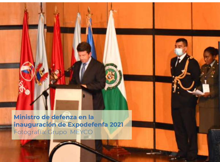
Ministro de defensa en la inauguración de Expodefensa 2021

Con la participación del Fondo Rotatorio de la Policía, se llevó a cabo en el Centro internacional de Negocios y Exposiciones de Bogotá una nueva versión de Expodefensa.