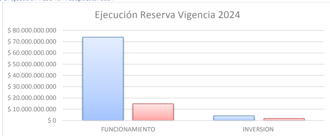
Gráfico 2: Ejecución Reserva Presupuestal 2024

Durante el primer trimestre se inició la ejecución de los recursos asignados a la reserva de gastos de funcionamiento. No obstante, al cierre del tercer trimestre, permanece pendiente la ejecución del 79,96% de estos recursos, lo que evidencia un rezago significativo en esta categoría. Este comportamiento podría comprometer el cumplimiento de las metas operativas si no se adoptan medidas correctivas oportunas.